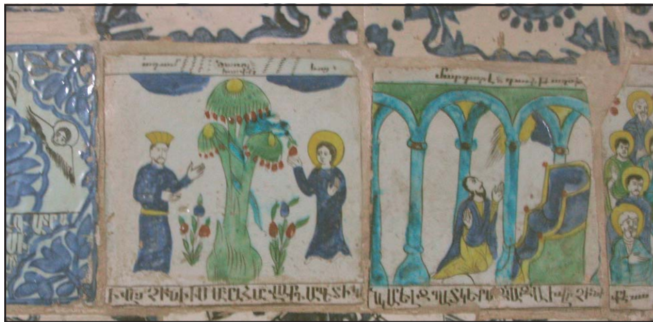
Carreaux de revêtement, Adam et Ève à gauche et David en prière à droite, Kütahya, 1718-1719. Jérusalem, Patriarcat arménien. - 40