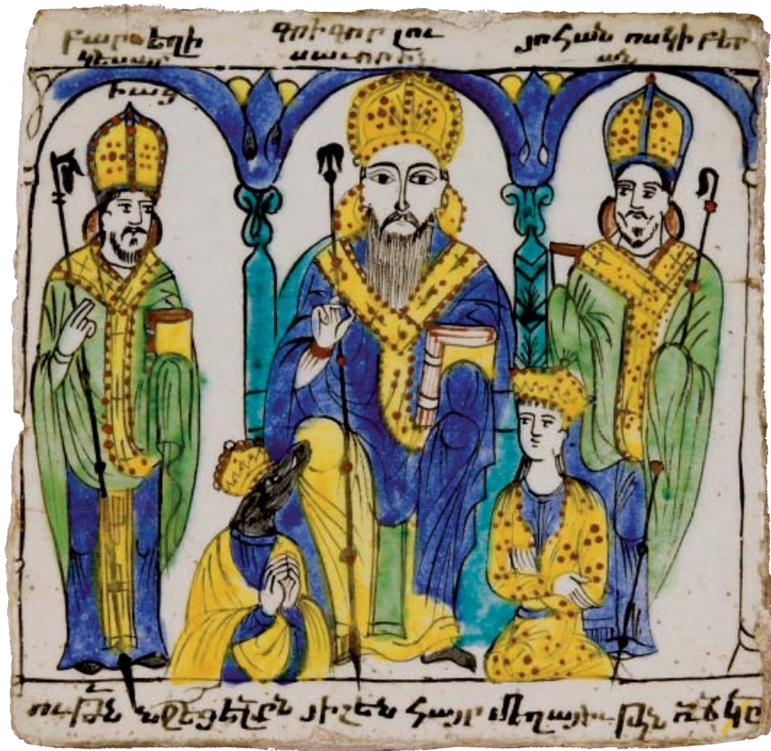
Carreau de revêtement, saint Basile de Césarée, saint Grégoire l'Illuminateur, saint Jean Chrysostome, et en bas le roi Tiridate et sa sœur Khosrovidukht, Kütahya, 1718-1719. - 39