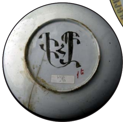
Plat : Saint Jean-Baptiste et le monogramme d'Abraham sur la base, Kütahya, 1719. - 37