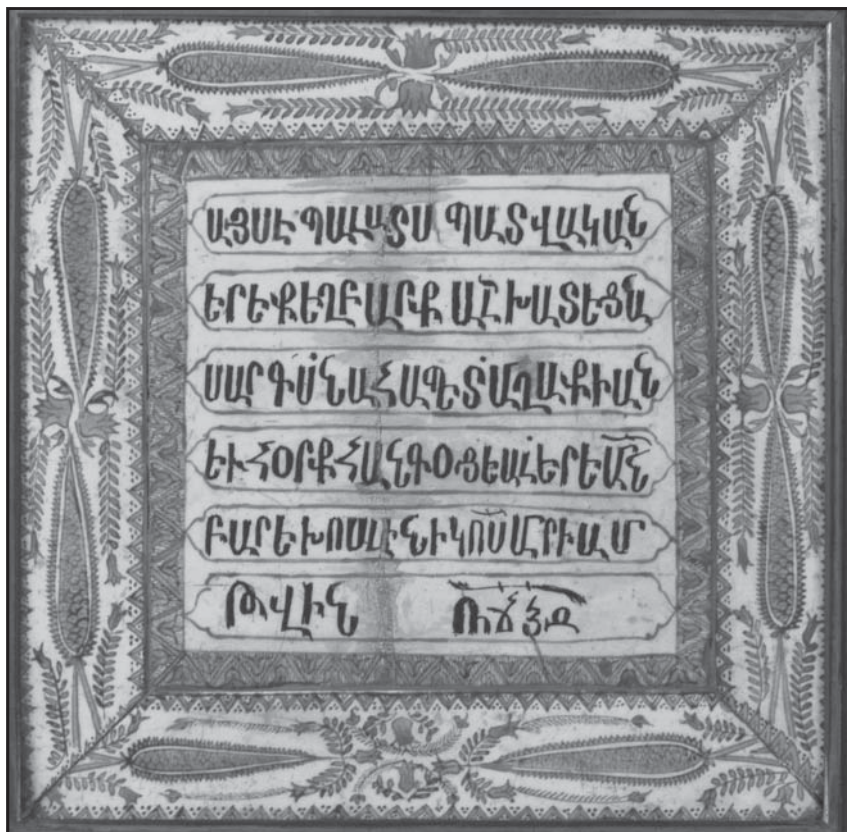
Carreau, Kütahya, 1737. - 41