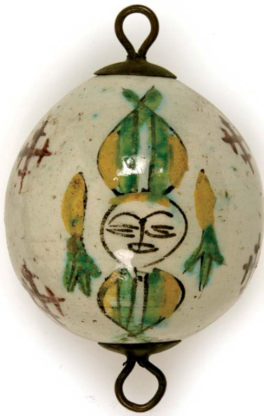
Œuf de suspension, Kütahya, XVIII e siècle. - 42