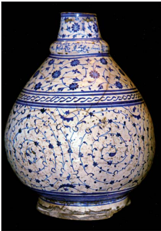
Bouteille et inscription sur la base, Kütaḥya, 1529.